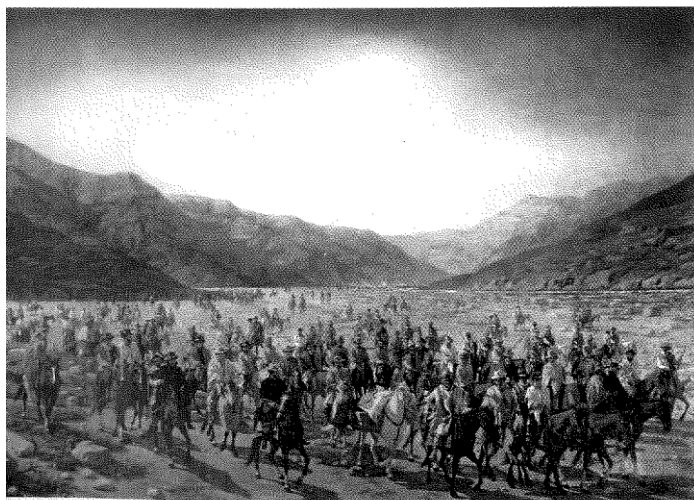
Doc. 13 Retirada de las tropas encabezadas por Lavalle luego de ser vencidas por los ejércitos de Rosas, en 1841.

Aunque en 1839 Rosas pudo controlar las insurrecciones en Buenos Aires y el Litoral, el panorama era un tanto incierto en el interior del país. Para entonces, el general Lavalle había organizado una expedición militar que invadió Entre Ríos, Corrientes y Córdoba, y continuó luego su marcha hacia el norte del país. Mientras Lavalle avanzaba, el gobernador tucumano Marco Avellaneda decidió hacer público su rechazo a Rosas. Formó entonces la Coalición del Norte , que fue integrada también por las provincias de Salta, Catamarca, La Rioja y Jujuy. Rosas debió entonces enviar al general tucumano Aráoz de Lamadrid a combatir a la Coalición. Sin embargo, este militar decidió unir sus fuerzas con las de los sublevados. En esa región del país, las intervenciones de Rosas y la crisis económica fortalecieron a la oposición, que fue estimulada por los jóvenes de la Generación de 1837. Para vencer a los rebeldes, Rosas envió un poderoso ejército al mando del uruguayo Manuel Oribe. Este ejército derrotó a las fuerzas de Lavalle en Tucumán. El jefe unitario, que estaba herido, intentó huir hacia Bolivia (doc. 13) pero murió en Jujuy. Oribe venció entonces a las fuerzas de la Coalición del Norte y ordenó degollar a sus jefes, entre ellos a Marco Avellaneda. Así Rosas logró vencer a todos sus adversarios y consolidarse en el poder.