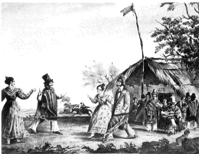
Doc. 12 Cielito . Obra realizada por Carlos Pellegrini en 1835.

Las expresiones culturales populares tuvieron una contracara que emanó directamente de los sectores acomodados de Buenos Aires. Fueron estos hombres y mujeres los que prefirieron continuar con la tradición de las reuniones literarias, la redacción de materiales escritos, el debate de ideas en las residencias o en ciertos cafés. Sin embargo, llegado el momento tales prácticas se acotaron, pues Rosas consideró que se oponían al espíritu federal y sus nociones de orden y uniformidad. Pero aquellos que ante el peligro o las prohibiciones decidieron tomar el rumbo del exilio continuaron practicándolas.