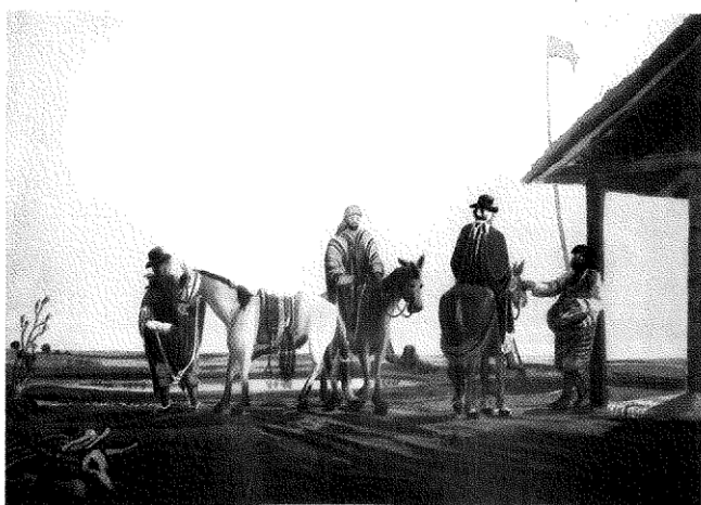
Doc. 9 Antes de la sanción de la Ley de Aduanas los ponchos que usaban muchos de los gauchos de la campaña bonaerense eran fabricados en Gran Bretaña. La ley sancionada por Rosas prohibió la importación de esos artículos textiles.

Aunque a lo largo de los años el gobernador de Buenos Aires rechazó compartir los ingresos de la Aduana porteña, intentó por dos vías compensar el desequilibrio entre su provincia y las del interior. Una era el otorgamiento de subsidios a las provincias a fin de que pudiesen hacer frente a su déficit fiscal. Pero esa política reforzaba aún más su dominio sobre las provincias beneficiadas. Por otra parte, a comienzos de su segundo mandato, Rosas propuso la sanción de una Ley de Aduanas que establecía el incremento de los aranceles de algunos productos manufacturados extranjeros. Asimismo, prohibía la importación de aquellos que se fabricaban en el país. La mayoría de esas