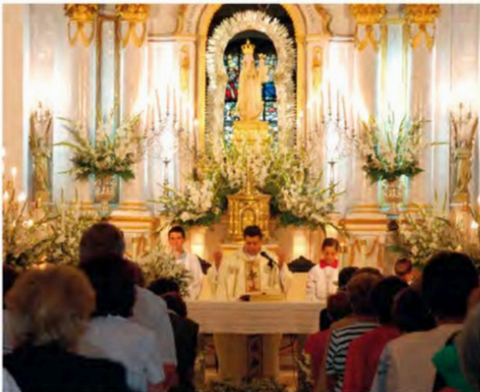
La misión de la Iglesia se alimenta con la celebración de la Palabra y la Eucaristía, y se refuerza mediante la formación cristiana de sus miembros.

En el Antiguo Testamento, el día del Señor es el sábado, pues Dios había declarado ese día sagrado para conmemorar su descanso en el séptimo día de la Creación.