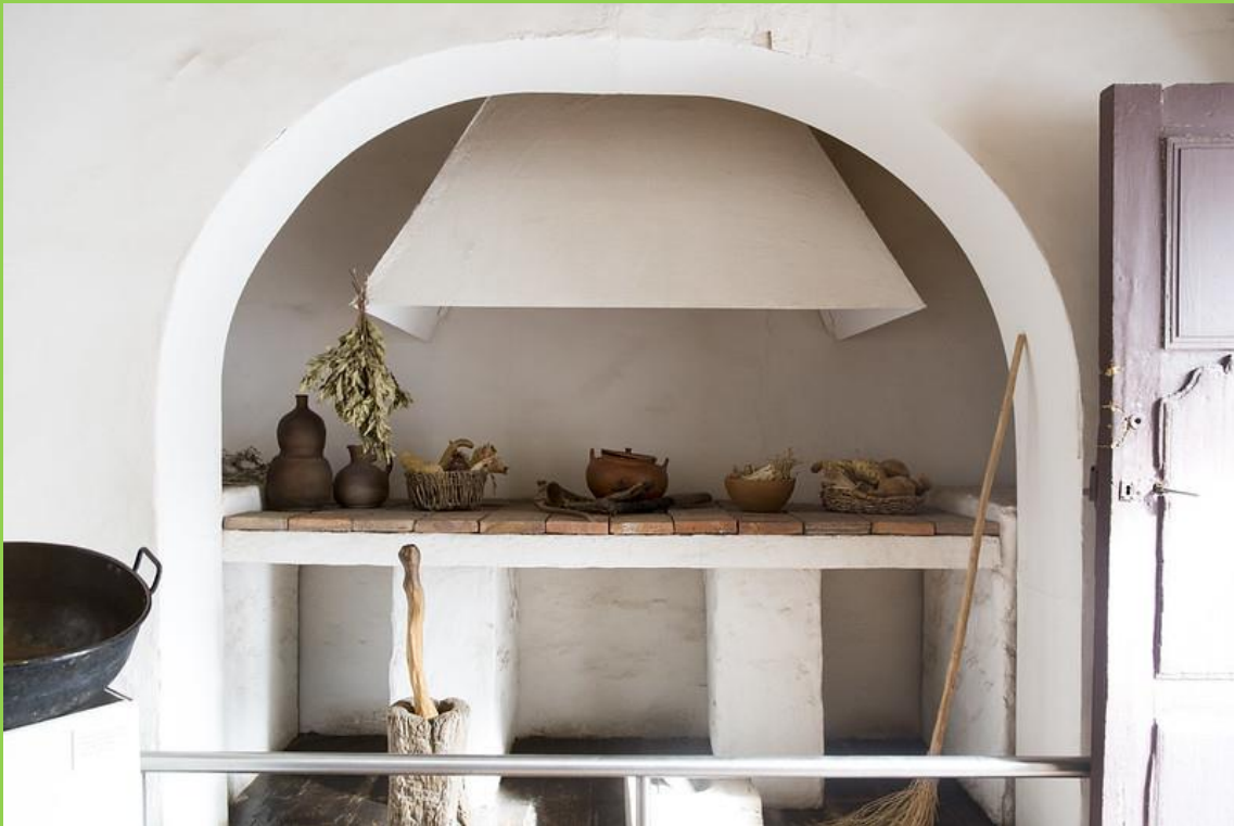
LA COCINA. EL FOGÓN FUE RECREADO DEBIDO A SU DERRUMBE EN EL TERREMOTO.