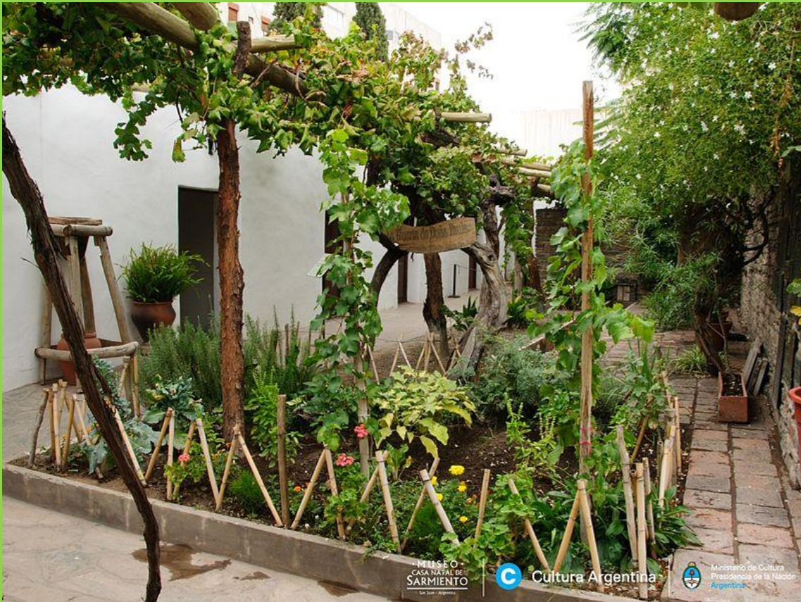
LA HUERTA FAMILIAR