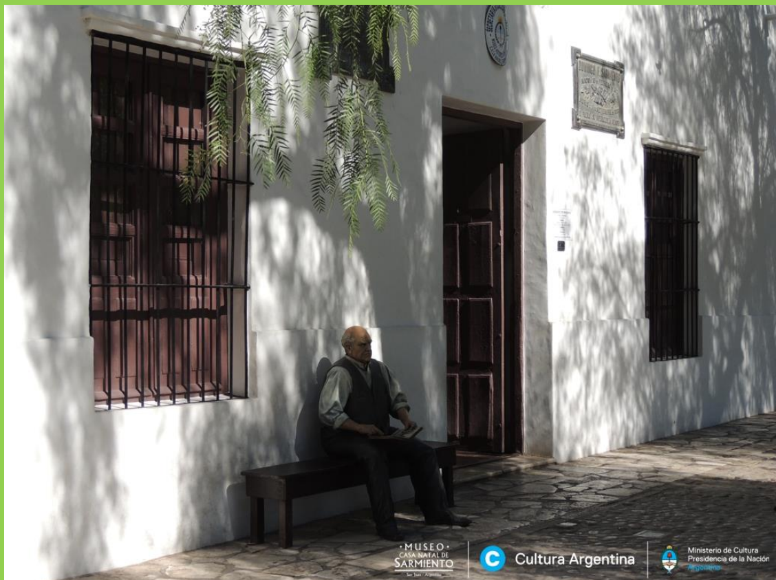
ESTATUA DE SARMIENTO EN LA VEREDA DE SU CASA NATAL

SU NOMBRE DE BAUTISMO ERA FAUSTINO VALENTÍN QUIROGA SARMIENTO