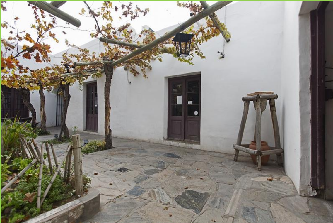
PATIO INTERNO CON PARRA Y HUERTA