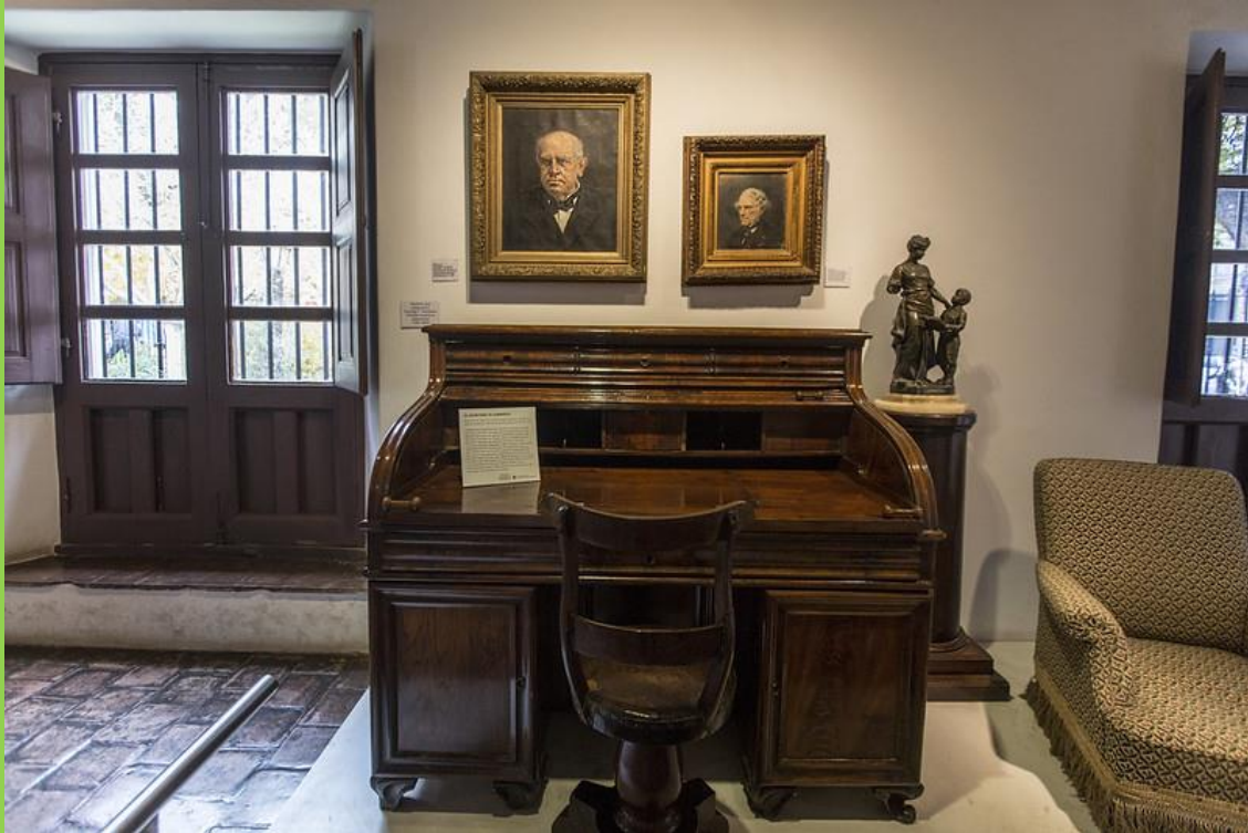
ESCRITORIO DE SARMIENTO. MUEBLES QUE USÓ COMO GOBERNADOR DE SAN JUAN EN 1862.