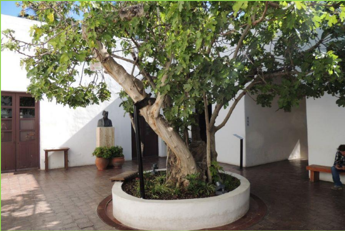
HIGUERA HISTÓRICA. DEBAJO DE ESTA HIGUERA SARMIENTO LEYÓ SUS PRIMEROS LIBROS.