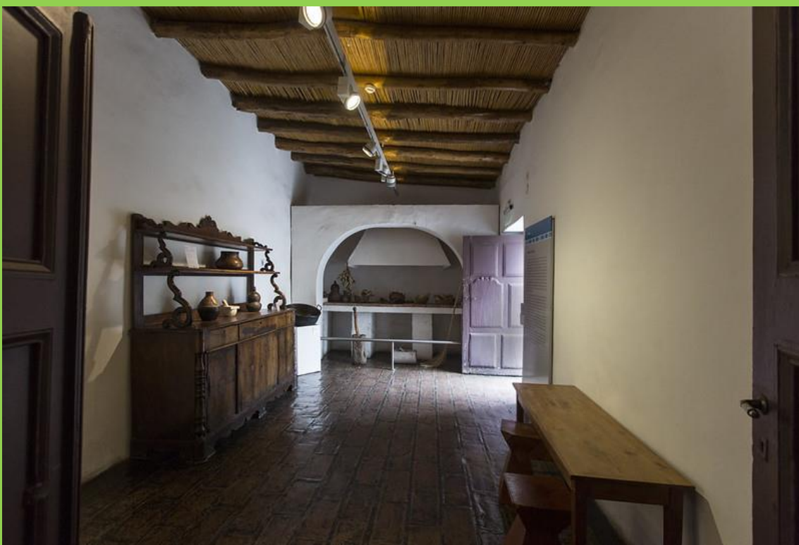
EL PISO ERA DE TIERRA APISONADA. ESTOS LADRILLOS DE ADOBE PERTENECEN A LA CATEDRAL DE SAN JUAN QUE SE DERRUMBÓ CON EL TERREMOTO DE 1.944