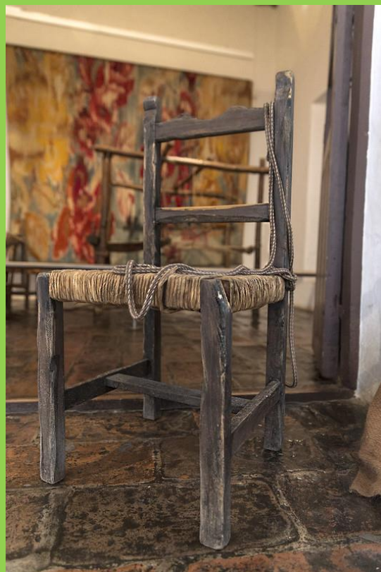
LOS MUEBLES MÁS SENCILLOS PERTENECEN A LA CASA NATAL.