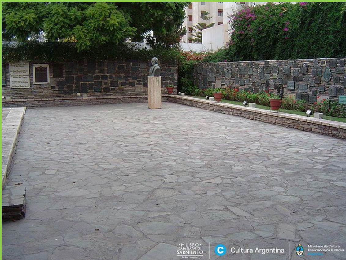
PATIO DE HOMENAJES. EN ESTE PATIO SE REALIZAN LOS ACTOS.