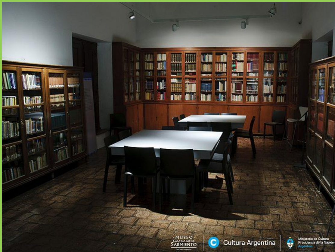
EN LA BIBLIOTECA SE ENCUENTRAN MÁS DE 5.000 EJEMPLARES Y LA COLECCIÓN COMPLETA DE SUS OBRAS.