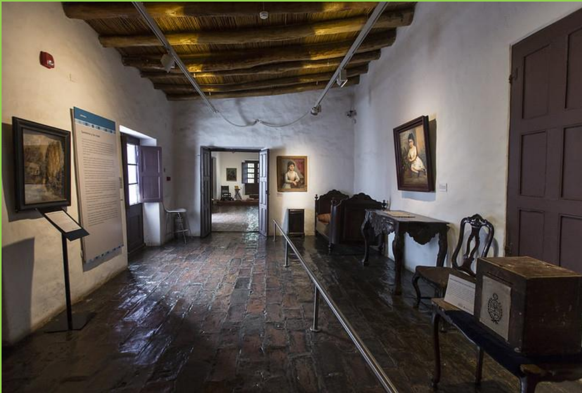
PAREDES DE ADOBE Y TECHO DE CAÑAS Y PALOS.