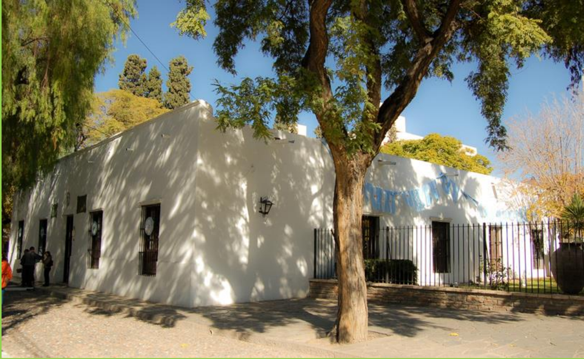
CASA NATAL VISTA EXTERIOR