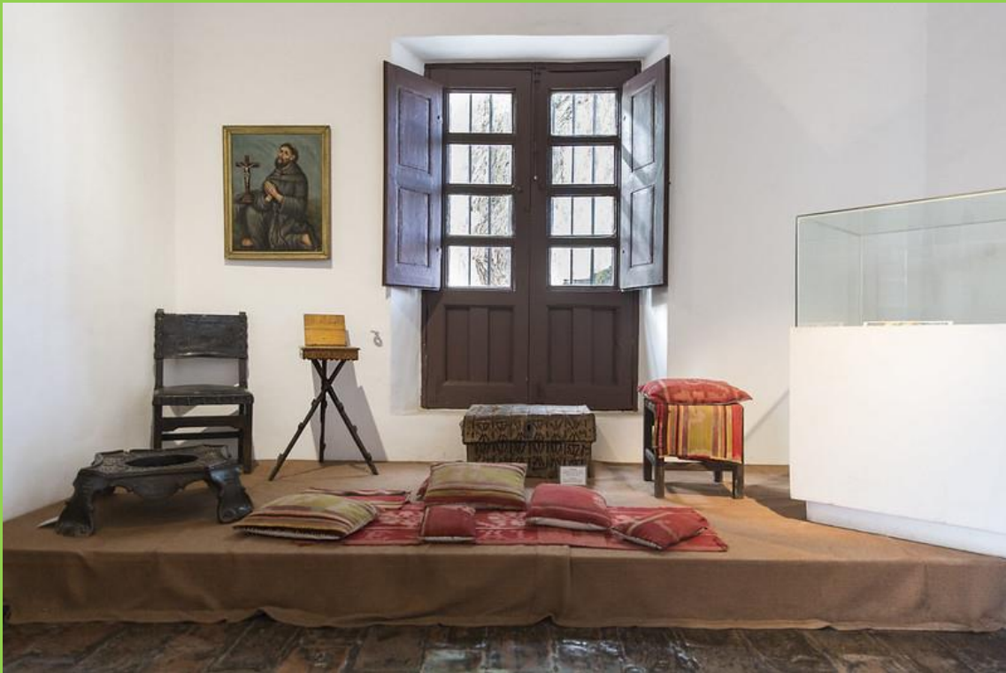
AQUÍ SE REUNÍAN LAS MUJERES A TEJER Y LA FAMILIA A REZAR Y LEER LA BIBLIA.