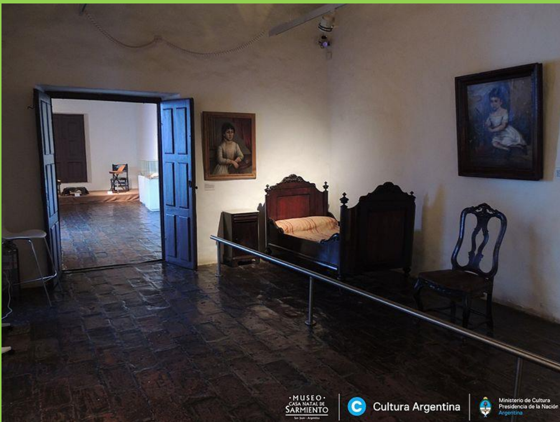
DORMITORIO USADO POR SARMIENTO DURANTE LA PRESIDENCIA EN 1.868