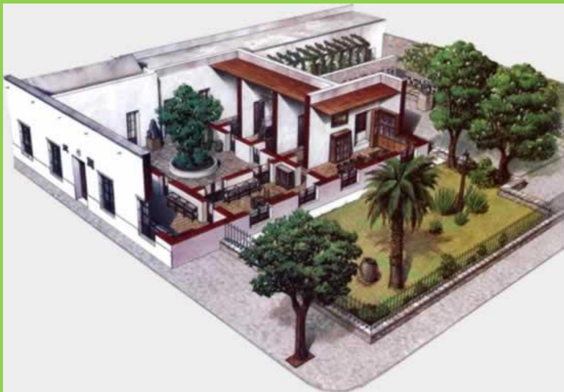
PLANO DE LA CASA COLONIAL