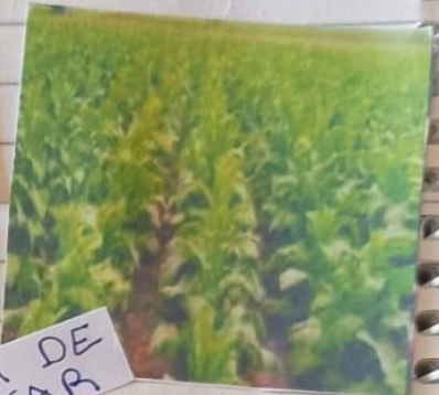
CANA DE AZUCAR