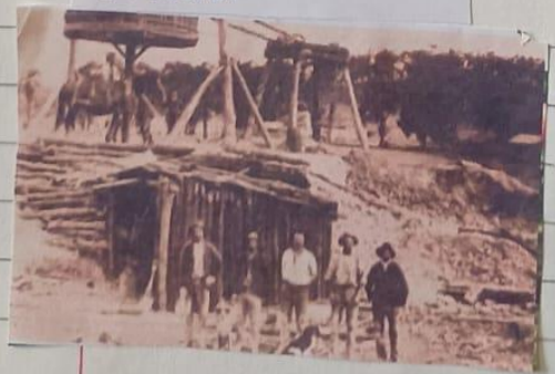
PUERTA DE UNA MINA