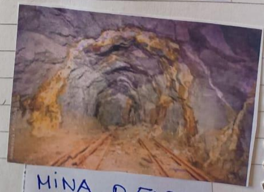
MINA DE ORO