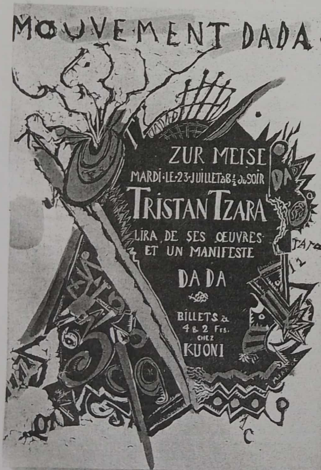
Marcel Janco, Mouvement Dadá, 1918.

La expresión “vanguardia histórica” se refiere a los movimientos artísticos surgidos a principios del siglo XX y que produjeron una ruptura mayor que las propuestas por las vanguardias del siglo XIX. El inicio de la vanguardia histórica puede ubicarse alrededor de 1910, con el surgimiento del futurismo. Su impulso perduró en una sucesión de movimientos hasta la década de 1930. La Segunda Guerra Mun-