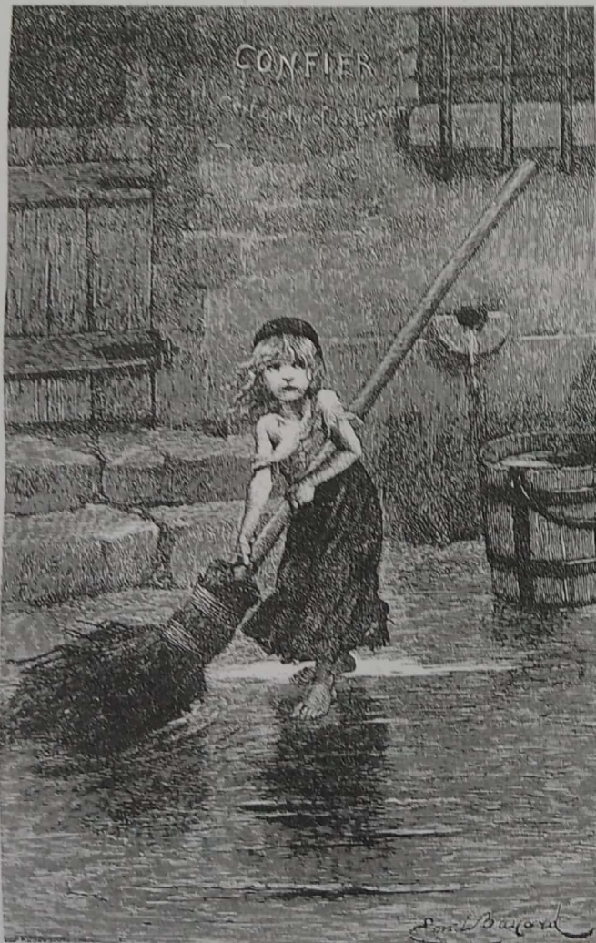
Ilustración de Los Miserables , de Víctor Hugo.

Hacia 1920, la vanguardia como concepto artístico ya estaba establecida y designaba todas las nuevas corrientes o movimientos cuyos programas estéticos se definían por su rechazo al pasado y el culto a lo nuevo. La novedad era buscada en el proceso de destrucción de la tradición, se consideraba que revolucionar el arte era un modo de revolucionar la vida.