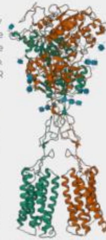
Receptor sensor de calcio

Las células del riñón y las del tejido óseo tienen un receptor para la hormona paratiroidea en sus membranas. Cuando este receptor es estimulado por contacto con la hormona, efectúa cambios importantes en la actividad de los órganos. Estos dos órganos actúan entonces para elevar la cantidad de \text{Ca}^{++} en la sangre.