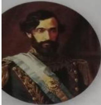
Bartolomé Mitre. Político, militar, historiador, escritor y estadista argentino. Gobernó la provincia de Buenos Aires y fue presidente de la Nación Argentina entre 1862 y 1868.