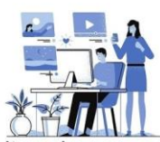
Medios de comunicación