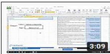
Asiento de Compra| Libro diario https://youtu.be/hsdJyVcU4HE