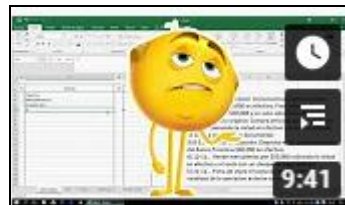
Libro diario Asientos simples https://youtu.be/kRYtOdHANn