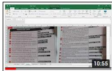
Registración en libro diario de ventas y CMV https://youtu.be/NJbFZW2-z-Y