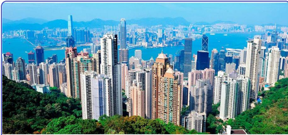
Hong Kong, ex colonia británica, es uno de los grandes centros financieros del mundo. Por la diversidad de actividades económicas, atrae a gran cantidad de población.

El cuarto foco de población se localiza en la costa nordeste de América del Norte. En ella resalta la gran megalópolis americana que se extiende desde Boston hasta Washington. Fuera de estos cuatro focos, existen grandes metrópolis, como México, San Pablo, Buenos Aires, etc., cuya principal característica es la concentración poblacional con los espacios circundantes de débil ocupación.