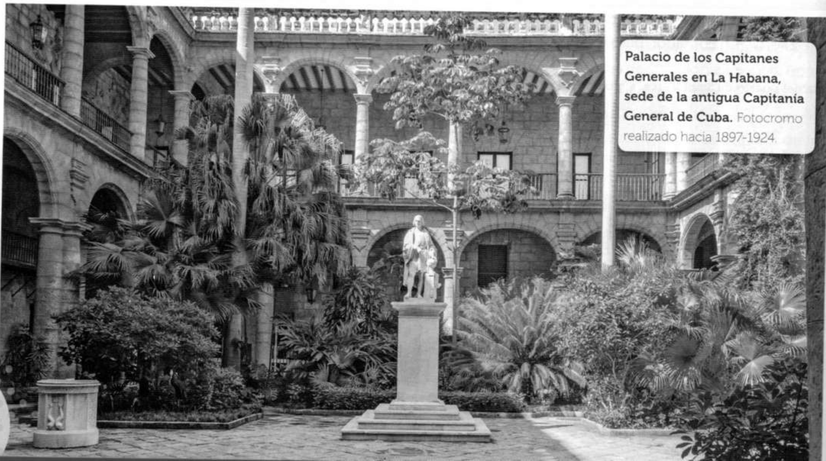
Palacio de los Capitanes Generales en La Habana, sede de la antigua Capitanía General de Cuba. Fotocromo realizado hacia 1897-1924.

Otras divisiones administrativas eran las capitanías generales, territorios fronterizos administrados por un capitán general. En estos casos, el virrey solo tenía poder de supervisión, porque los capitanes generales se comunicaban directamente con el rey y con el Consejo de Indias.