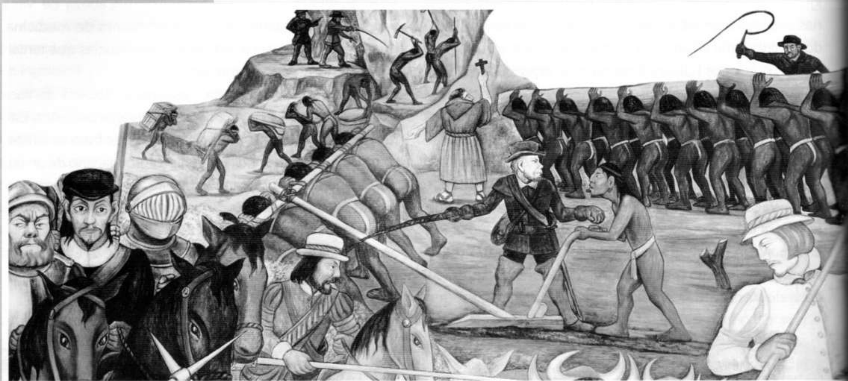
Desembarco de los españoles en Veracruz. Detalle del mural de Diego Rivera.