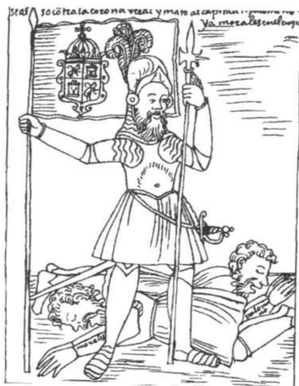
Un encomendero español, dibujo de Guamán Poma de Ayala.

Buscando suavizar las condiciones de los indígenas y, sobre todo, ante las posibilidades que brindaban los nuevos territorios, la monarquía implementó una nueva táctica basada en el incremento de la emigración de colonos que asegurase el control de las tierras y garantizase el vínculo político con la metrópoli. Nació así la encomienda , un sistema en el cual los aborígenes eran considerados menores de edad y, por lo tanto, se los "encomendaba" (de allí el nombre de "encomienda") a diferentes españoles para recibir protección y ser evangelizados, es decir, convertidos a la fe católica. A cambio debían trabajar en las tierras de los encomenderos y pagarles un tributo.