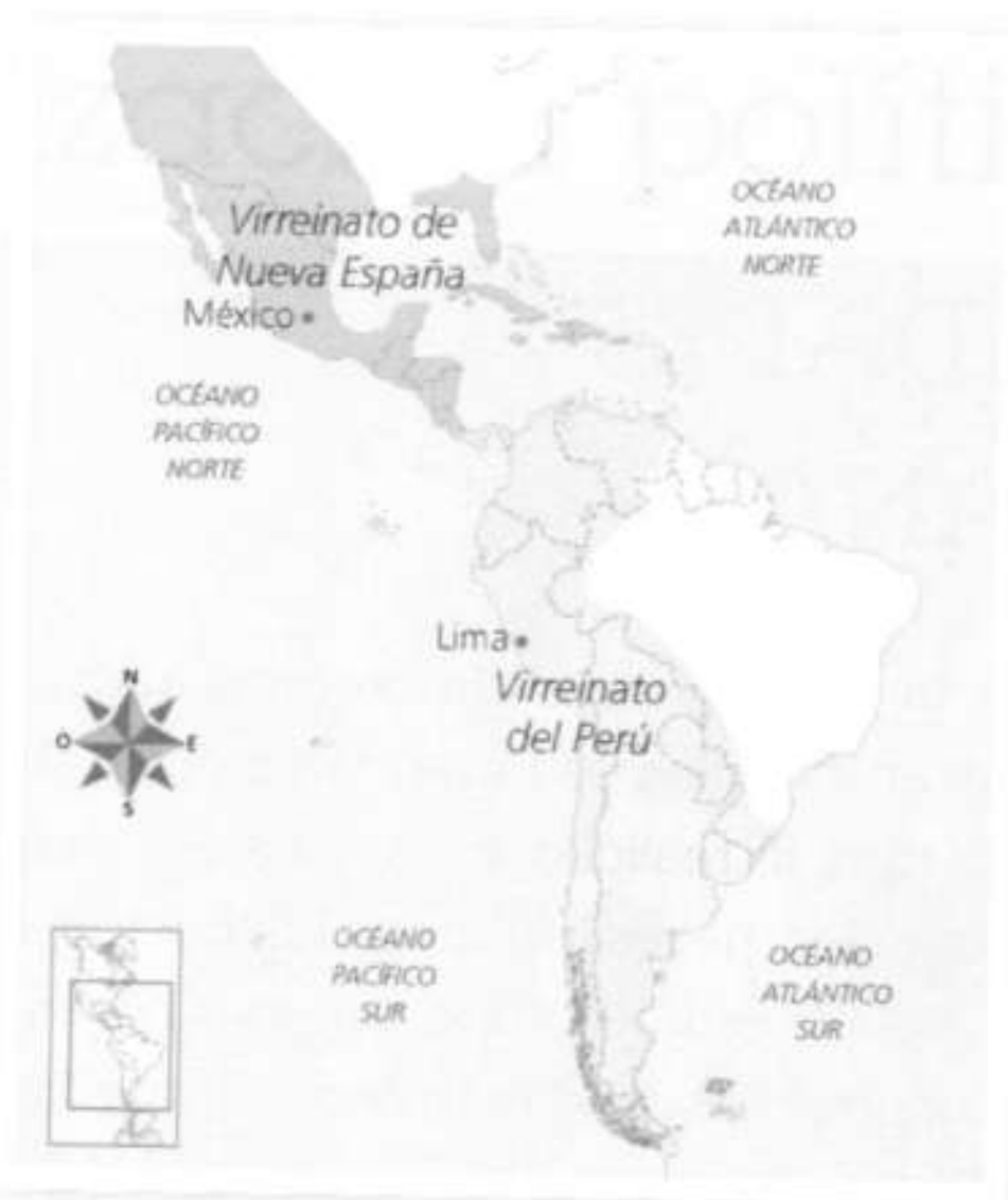
← Los primeros virreinos.

cho, los virreyes debían demostrar que descendían de varias generaciones de cristianos. Además, para evitar que crearan lazos con las familias locales y pudieran traicionar a la autoridad real, tenían prohibido formar familia en América.