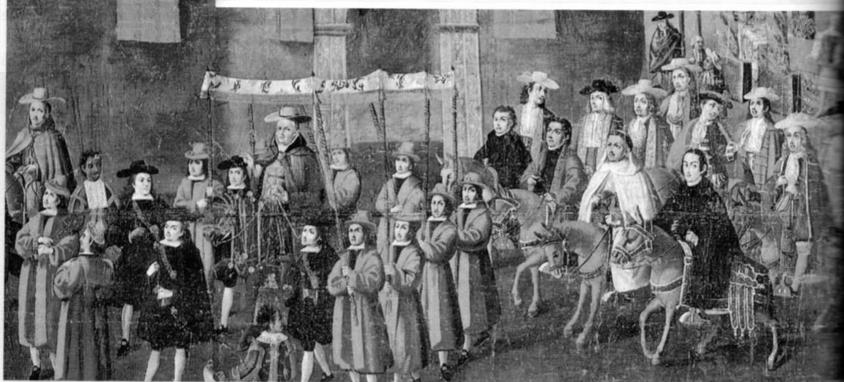
▲ La entrada del virrey arzobispo Morcillo en Potosí, detalle de un óleo de Melchor Pérez Holguín, 1718.