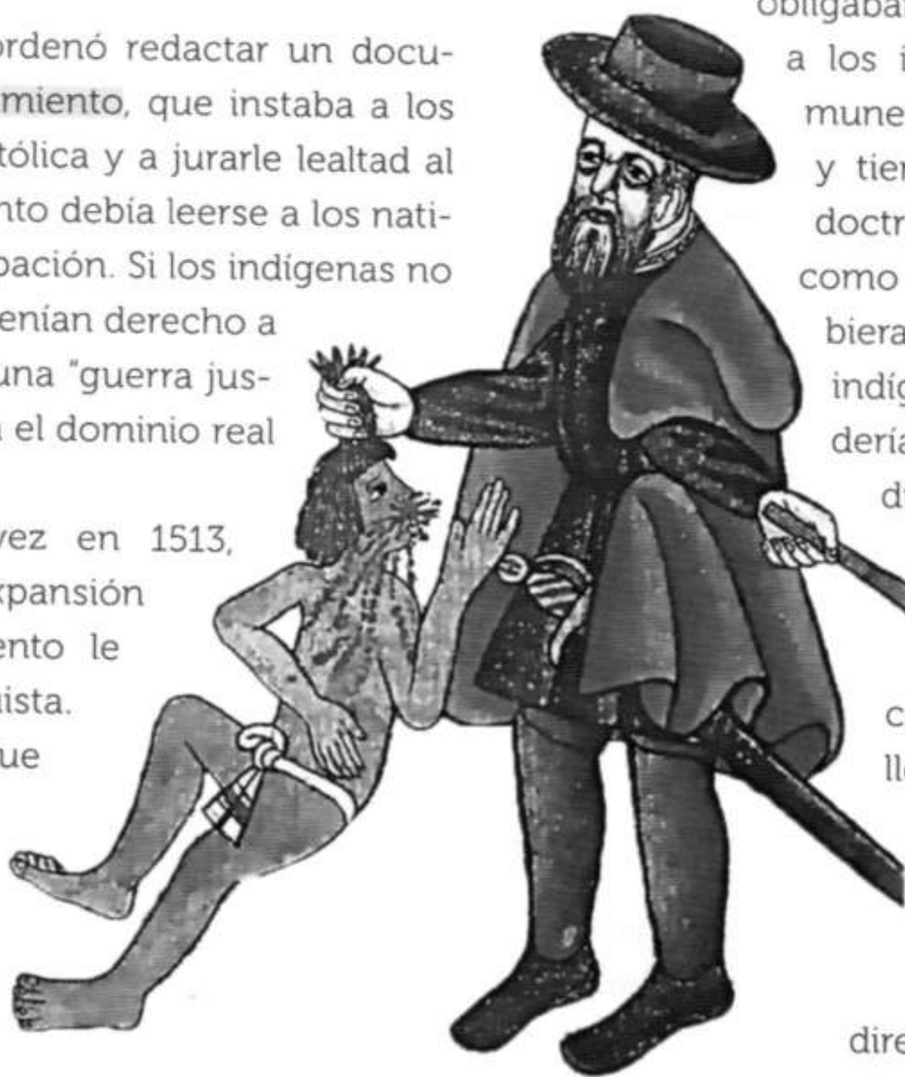
Encomendero maltratando a un indígena. Representación según el Códice Kingsborough .

Si bien estas ordenanzas prevenían castigos para las autoridades que no cumplieran las directivas, pocas veces las denuncias en su contra llegaban a buen término, pues sus superiores los amparaban.