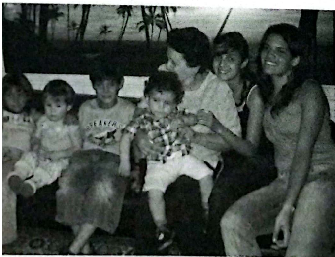
Encuentro entre cuatro generaciones.

Todos podemos reconocer entre un chico y un grande, pero ¿alguien puede darse cuenta en qué momento pasó de un estado al otro?, ¿cuál fue el día en que un bebé empezó a ser un niño? Estos momentos nunca pueden identificarse ya que los cambios se producen de forma imperceptible. Y por lo tanto la división en etapas puede resultar artificial, el paso entre esas etapas es un proceso que guarda una relativa continuidad, se da una serie de rasgos que constituyen una mentalidad típica, pero pasajera. Como consecuencia de lo dicho se entiende que cuando se indican edades cronológicas correspondientes a cada etapa, estas son solo aproximaciones sujetas en todos los casos a la determinación de múltiples variables.