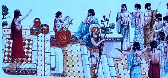
En las asambleas atenienses se resolvían las cuestiones relacionadas con la comunidad.

Desde mediados del siglo XX, la ciudadanía es vista como un conjunto de prácticas que le permiten a alguien ser miembro de una sociedad. Y los ciudadanos pueden realizar esas prácticas o acciones porque se les han reconocido una cantidad de derechos. A través de las acciones y los derechos, logran influir en las decisiones políticas. En resumen, ser ciudadano o ciudadana es poseer iguales derechos , tener conciencia de ellos y poder ejercerlos; participar en la construcción y transformación de la sociedad para crear las condiciones de igualdad en las que todos puedan ser efectivamente ciudadanos, y sentirse parte de una comunidad.