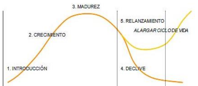
El ciclo de vida de los productos