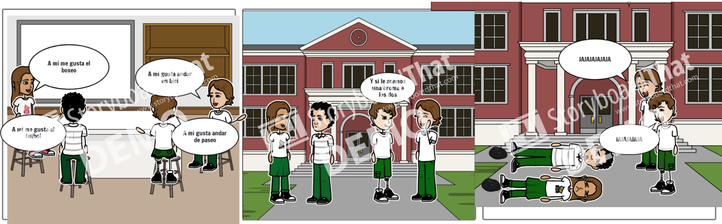
Cree sus los propios en Storyboard That