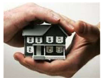
Seguro: bienes y personales.