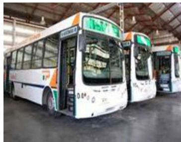
Transporte: de personas, de títulos y de documentos