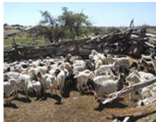
Productivas: agricultura, ganadería.