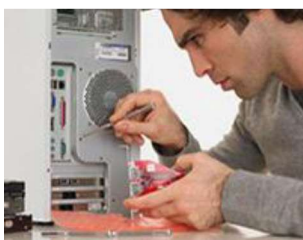
Computación: servicios (informática, registros)