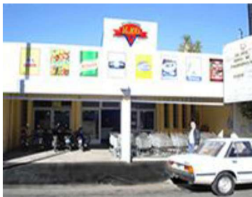
Comerciales: minoristas, mayoristas.