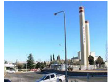
Fabriles: vestimentas, rodados, alimentación.