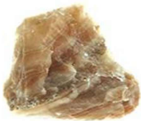
Extractivas: mineras, petroleras.