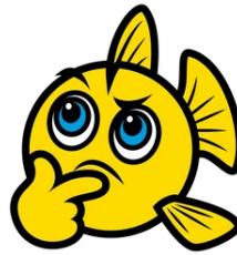
TABLA DEL 3

1- Completa la tabla del 3. Luego observa las indicaciones y colorea como se te indica.