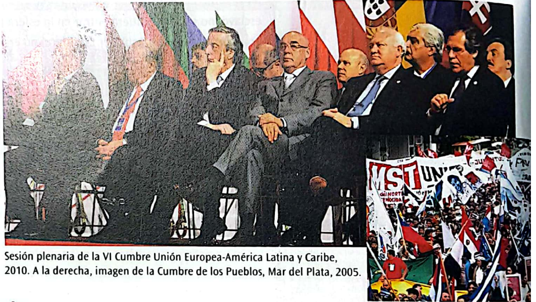
Sesión plenaria de la VI Cumbre Unión Europea-América Latina y Caribe, 2010. A la derecha, imagen de la Cumbre de los Pueblos, Mar del Plata, 2005.

Pensaremos a la política en dos sentidos: como ámbito de lo público y del interés general, atravesado por conflictos y por relaciones de poder, y también como lugar en el que es posible expresar las inquietudes y participar para construir una sociedad mejor.