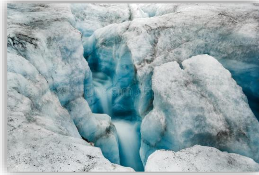
“Glaciar Serp- i- Molot, Nueva Zembla, Océano Glaciar Artico”.