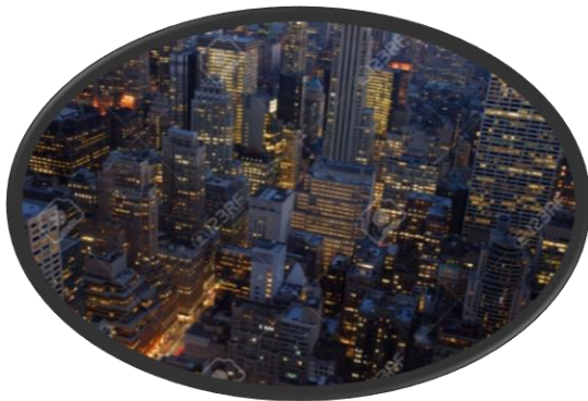
“Vista aérea nocturna de la Ciudad de Nueva York”.

Podemos diferenciar dos tipos de paisajes. Por un lado, los paisajes naturales, en los que el hombre no ha intervenido, aunque son muy pocos en la actualidad, ya que las sociedades han modificado el ambiente a lo largo de los años. Por otro lado, los paisajes humanizados, aquellos que han sido modificados por el hombre y llamaremos “humanizados”.