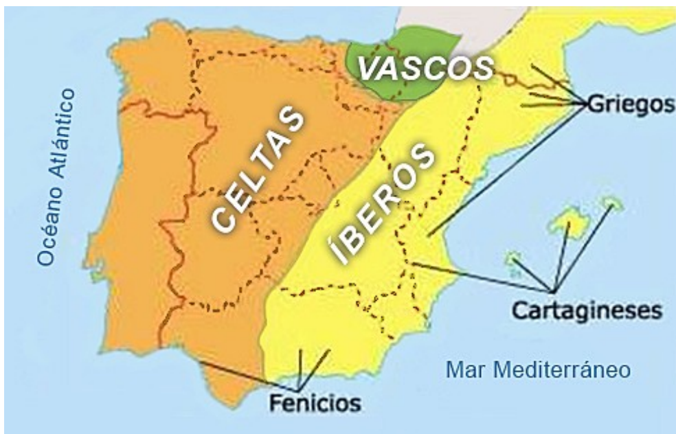
distribución de pueblos que habitaban la península ibérica antes de la conquista romana.

Muchas lenguas de estos pueblos dejarán su huella en el latín que traerían los romanos. Eventualmente, con el paso de los siglos, los rastros lingüísticos de esas lenguas se encontrarán también en el castellano.