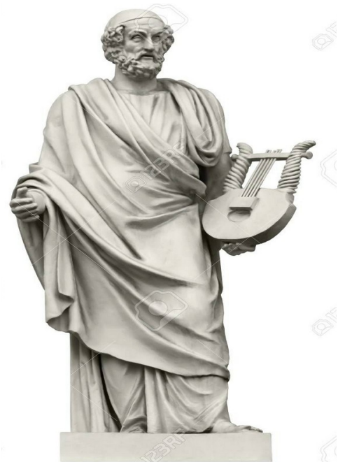
Estatua del antiguo poeta griego Homero (siglo VIII a. C.) Se le atribuyen las obras épicas "Ilíada" y "Odisea"

La lengua griega , además de ser el instrumento de expresión del sorprendente "milagro griego" (la explosión de las artes y las ciencias, así como de la democracia como sistema político, en la Antigüedad clásica), fue a lo largo de los siglos, y lo sigue siendo, el principal referente, el gran almacén etimológico, para el lenguaje de la cultura en general y, en particular, para la creación de neologismos técnicos y científicos en todas las disciplinas. Si nuestra lengua no es otra cosa que un latín evolucionado, hablado sin interrupción durante más de dos mil años, el griego antiguo también vive en nuestro léxico diario , cuando tomamos un analgésico , vamos al cine , o sentimos nostalgia .