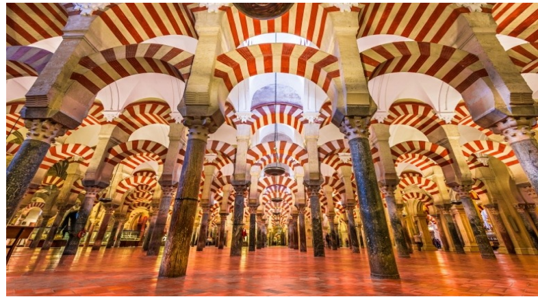
Mezquita de Córdoba, construida en el año 784.

Los árabes tenían una cultura muy rica: eran muy avanzados en matemática, comercio, religión, literatura, filosofía, astrología, química, medicina , entre muchas otras ciencias. Ellos llevaron a la península ibérica su vasta cultura. Esta brillante civilización dejó huellas imborrables. Verdaderas joyas arquitectónicas son grandes ejemplos de su paso por la península ibérica: la Alhambra de Granada, el Alcázar de Sevilla, la Mezquita de Córdoba.