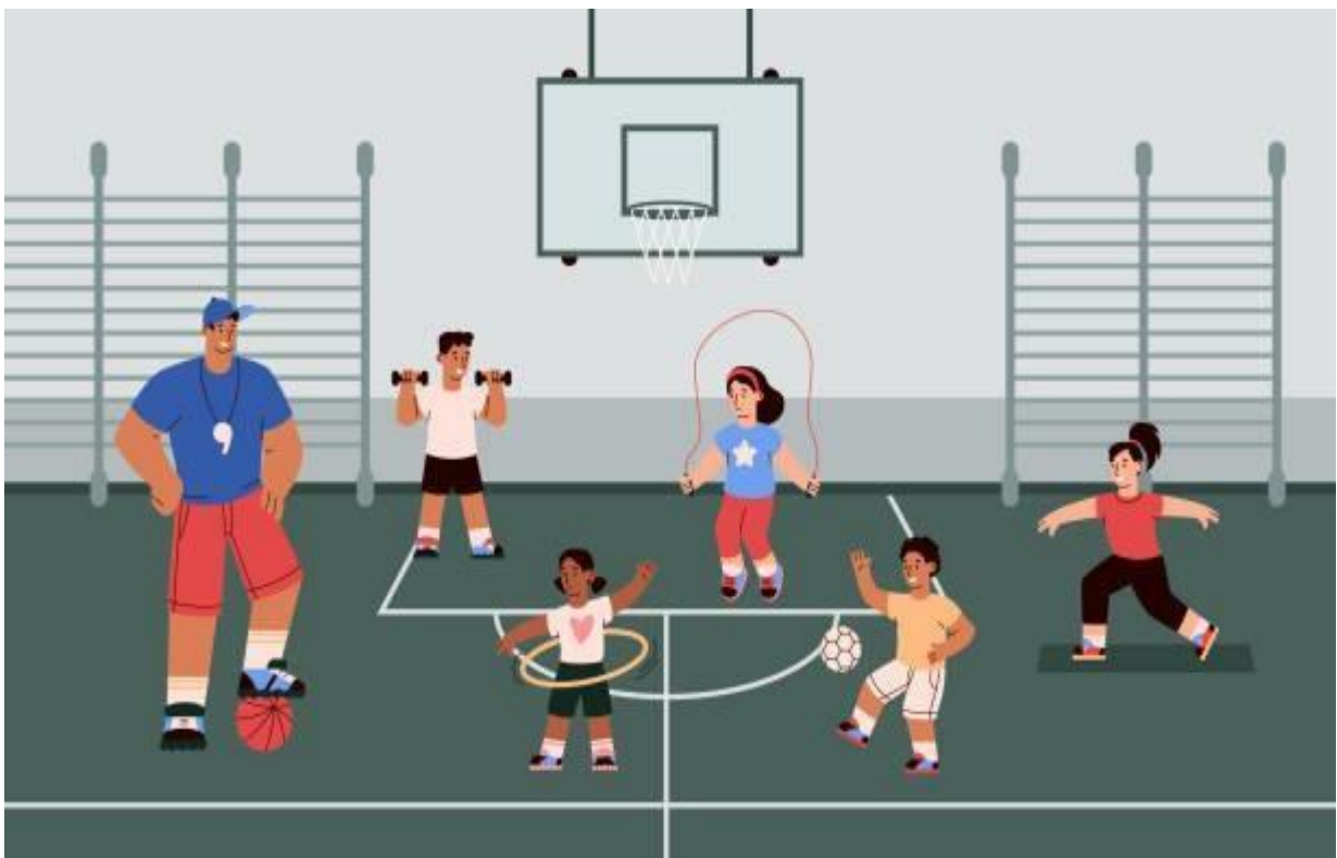
Anatomía del cuerpo humano.

En las clases de educación física se aprende a llevar a cabo diferentes actividades que requieran de un esfuerzo físico sin dañarnos, a ejercitar el cuerpo y conocer nuestras limitaciones y logros.