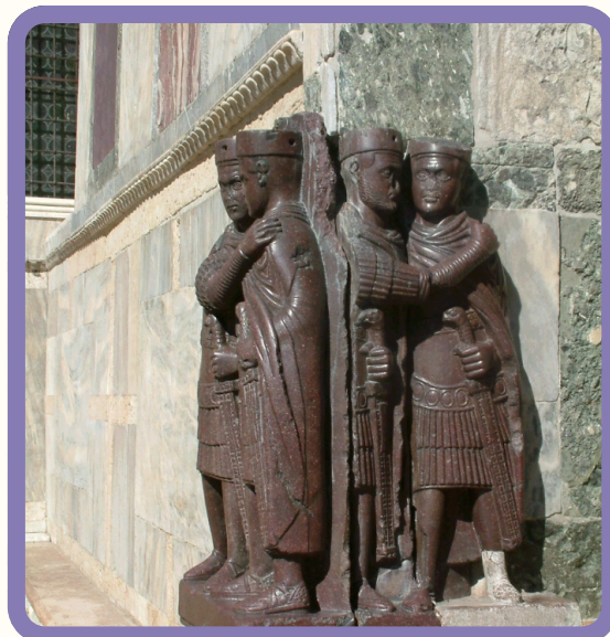
foto de la estatua representativa de la tetrarquía que significa "gobierno de cuatro"

Entre los emperadores del Bajo imperio se destacaron Diocleciano y Constantino. Diocleciano (284-305) inició un sistema conocido como tetrarquía, que significa "gobierno de cuatro". Para esto dividió el imperio Romano en dos partes: el imperio de Occidente, con capital en Roma y el imperio de Oriente con capital de Bizancio. Constantino (324-337) estableció la capital del imperio en la antigua colonia griega de Bizancio, a orillas del río Negro favoreciendo la navegación y el comercio. En el año 380, el emperador Teodosio consagró el cristianismo como religión oficial.