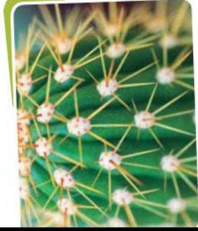
Las hojas de los cactus se han modificado y tienen forma de aguja. Esta adaptación reduce la pérdida de agua.