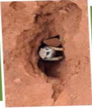
En muchas especies de animales, varios individuos vigilan la entrada de las cuevas de posibles predadores.

Algunos animales, como las vizcachas, una clase de roedor, son cavícolas, es decir, viven en cuevas, donde la temperatura se mantiene relativamente estable, a pesar de los cambios abruptos entre el día y la noche que se registran fuera de estos refugios. Estas cuevas suelen formar parte de galerías subterráneas en las cuales algunas aves construyen sus nidos, por ejemplo, las golondrinas ceja blanca, la caminera común y las lechucitas de las vizcacheras. Las cuevas también funcionan como refugio para otros seres vivos como ranas, sapos, reptiles e insectos.