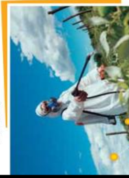
Los pesticidas pueden afectar a las personas que los esparcen.