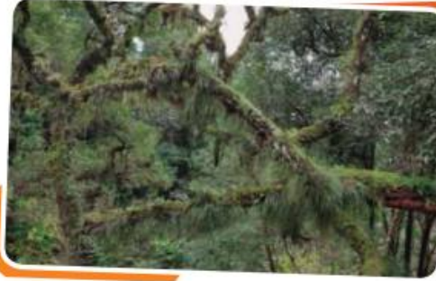
En las selvas, la humedad y las lluvias son abundantes, y hay una gran cantidad de vegetación.

En los ambientes aeroterrestres, la temperatura y la humedad suelen variar mucho, y esto favorece la presencia de más o menos vegetación. De acuerdo con la cantidad de vegetación, los ambientes aeroterrestres más típicos de nuestro planeta son las selvas, los bosques, los pastizales, las estepas y los desiertos.