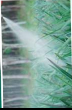
Los herbicidas se rocían sobre las plantas y pueden ser tóxicos para las personas y otros seres vivos.

En red. La red conceptual del capítulo. Después de leer esta página, ir a la ficha 4.