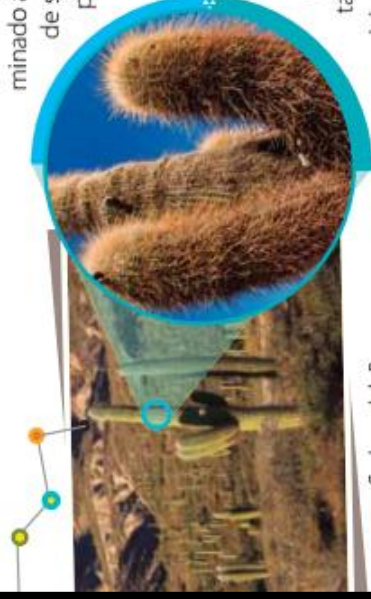
Cardones de la Puna.

Esta diferencia favoreció que en la descendencia hubiera más cardones con la adaptación favorable para un ambiente seco, y menos descendencia de los que no la tuvieran. Con el paso del tiempo, hubo cada vez más cardones con esta adaptación, y en la actualidad podemos observar que todos la tienen.