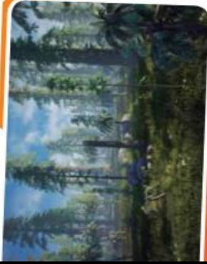
A través de las investigaciones que realizan diversos científicos, es posible recrear con imágenes cómo eran los ambientes en el pasado.

Los árboles eran parecidos a pinos gigantes y de ellos se alimentaban los dinosaurios. En aquella época, los reptiles más famosos de la historia, eran muy numerosos, algunos eran gigantes y tenían el mismo peso que 10 elefantes juntos y se alimentaban de las hojas y frutos de los árboles. Otros eran más pequeños y rápidos y se alimentaban de otros dinosaurios. Además, había muchos helechos, algunos tan grandes como árboles. También había araucarias que son árboles que hoy encontramos en Misiones y en Neuquén. El sur de la Argentina estaba cubierto de bosques que crecían en un clima muy cálido y húmedo.