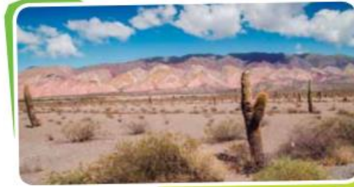
En los desiertos, la humedad y las lluvias son escasas al igual que la vegetación.

A su vez, la abundancia y riqueza de vegetación favorece la presencia de mayor diversidad de animales. Por este motivo, las selvas tienen mayor variedad de animales que los desiertos.