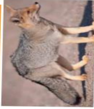
El zorro gris tiene un pelaje tupido que le permite mantener el calor del cuerpo y a su vez aísla la piel del frío.

Otra adaptación relacionada con los cambios de temperatura a lo largo del día y, en algunos casos, a lo largo del año, es la presencia de algún tipo de cobertura corporal. Los pelos en los mamíferos y las plumas en las aves son ejemplos de cobertura corporal que sirven de "abrigo" porque aíslan el cuerpo del ambiente e impiden los cambios bruscos en la cantidad de calor del cuerpo.