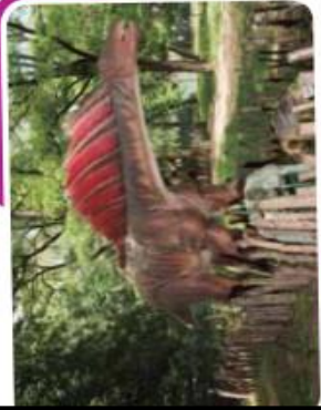
Las maquetas de los dinosaurios herbívoros y carnívoros nos dan una idea del gran tamaño que tenían estos enormes animales.

Los mamíferos de aquella época eran muy pequeños, comparados con muchos de los que existen en la actualidad, y habitaban en pequeños pozos subterráneos que los mantenían a salvo de los predadores. Recién hace unos 60 millones de años, cuando se produjo la gran extinción de los dinosaurios, los pequeños mamíferos comenzaron a vivir más tiempo fuera de sus refugios, y esto les permitió acceder a nuevos hábitats y alimentos.