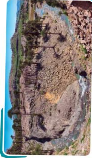
A partir de diversas investigaciones, los científicos propusieron que el ambiente aeroterrestre en el que vivían los dinosaurios era similar al que se puede observar en el parque provincial Copahue en la provincia del Neuquén.

Los mamíferos de aquella época eran muy pequeños, comparados con muchos de los que existen en la actualidad, y habitaban en pequeños pozos subterráneos que los mantenían a salvo de los predadores. Recién hace unos 60 millones de años, cuando se produjo la gran extinción de los dinosaurios, los pequeños mamíferos comenzaron a vivir más tiempo fuera de sus refugios, y esto les permitió acceder a nuevos hábitats y alimentos.