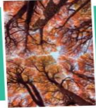
El cambio en el color de las hojas de verde a rojo o anaranjado indica que están próximas a caer.

Las plantas también tienen adaptaciones que les permiten sobrevivir a los cambios de temperatura. Por ejemplo, muchas pierden sus hojas en otoño, que brotan nuevamente en primavera, cuando las temperaturas y la cantidad de luz solar es más favorable para su desarrollo.