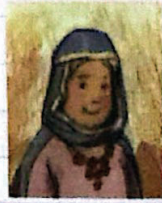
La mujer que ríe Gn 18, 9-15 y Gn 21, 1-8

a) ¿Quiénes son estas mujeres? Lo averiguamos leyendo las citas y ponemos el nombre de cada una en el recuadro.