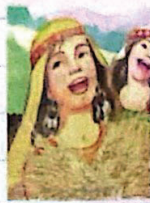
Solidaria y decidida Gn 24