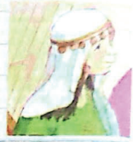
La mujer de mirada tierna Gn 29, 14-30