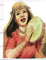
Hermosa y enamorada Gn 29, 1-30