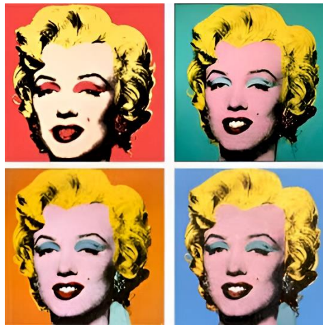
Shot Marilyns - Andy Warhol (1964)

Vamos a comenzar repasando lo que es el Arte Pop, o Pop Art en inglés. Se trata de un movimiento artístico que nació en Europa, en Inglaterra, y después llegó a Estados Unidos tras la Segunda Guerra Mundial. En ese momento, que puede haber sido la época en la que nacieron sus abuelos, la gente comenzó a comprar más cosas y la publicidad se volvió mucho más común que antes. También, aparecieron más programas de televisión, dibujos animados y películas. Los actores se hicieron muy famosos. A diferencia de otros movimientos, el Arte Pop no buscaba expresar emociones, sino repetir imágenes como si fueran hechas en una fábrica. Representaba objetos cotidianos, como latas de comida o personas famosas, como estrellas de cine en éste caso, para burlarse de la compra excesiva de objetos que no necesitamos y de la publicidad que invadía todas partes. Este movimiento usa colores llamativos y planos para hacer imágenes fáciles de reproducir. Con su arte, los artistas criticaban la sociedad de consumo, mostrando cómo la gente compraba mucho y se dejaba influenciar por las publicidades.