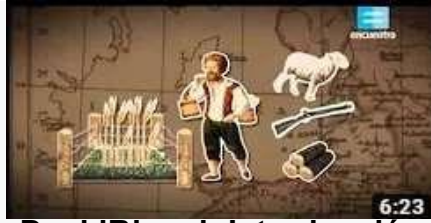
David Ricardo Introducción https://youtu.be/5rCRNMIQh4b5