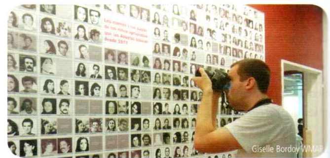
Mural con las fotografías de los padres y las madres de los nietos apropiados durante la dictadura, en la sede de Abuelas de Plaza de Mayo.

Durante esta etapa, todas estas organizaciones buscaron coordinar acciones y fortalecerse mutuamente. Ante las miles de detenciones y desapariciones se compartieron diversos actos públicos y se firmaron documentos, cartas abiertas y pronunciamientos en forma conjunta. Los organismos de derechos humanos reunían no solo a los afectados directos o a sus familias, sino a todos aquellos que no podían desempeñar sus actividades habituales en las organizaciones políticas o gremiales. Además, buscaron apoyo internacional en reclamo a los abusos de la dictadura. Las denuncias sobre los secuestros y desapariciones recibieron el apoyo de organismos extranjeros, como Amnesty International, y de los gobiernos de distintos países.