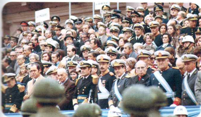
Junta Militar que encabezó el golpe de Estado de 1976.

En la Argentina, esta etapa fue llevada adelante por los militares que dieron un golpe de Estado el 24 de marzo de 1976 y establecieron una dictadura que se autodenominó Proceso de Reorganización Nacional . La Junta Militar que derrocó al gobierno constitucional de María Estela Martínez de Perón estaba integrada por los tres comandantes en jefe de las Fuerzas Armadas y dio inicio a una política de terror nunca antes vivida en el país.