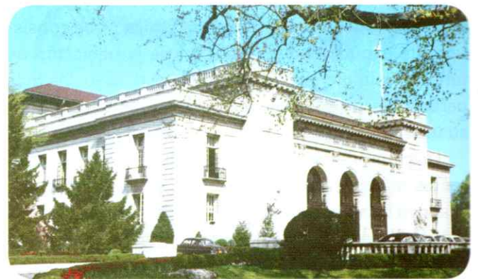
La sede principal de la OEA es en Washington, la capital de los Estados Unidos. Tiene representaciones y distintas oficinas en todos los países miembros.

¿Cuál es la función de la Corte Interamericana? Se trata de una institución judicial que vela por la aplicación e interpretación de la Convención Americana. Cuando un hecho de violación de derechos humanos reconocidos por esa Convención es presentado a la justicia del país donde ocurrió y no se resuelve satisfactoriamente, se puede acudir a la Comisión Interamericana de Derechos Humanos. Si la Comisión considera que el caso es admisible, lo transfiere a la Corte Interamericana para que investigue, juzgue y se expida.