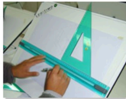
CURSO-TALLER: PROYECCIONES CILÍNDRICAS ORTOGONALES, AXONOMETRÍA Y PERSPECTIVA.