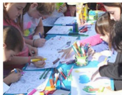
ACTIVIDADES Y EVENTOS