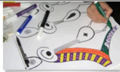
CURSO-TALLER: LA ESTÉTICA PRECOLOMBINA Y SU SIMBOLOGÍA.