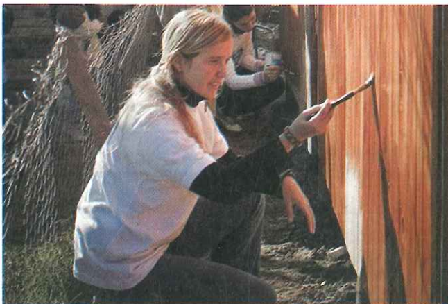
Grupo de integrantes de UTPMP en acción.

rantías, como la acción de amparo y el hábéas corpus , y todos los elementos necesarios para que no se vulneren derechos.