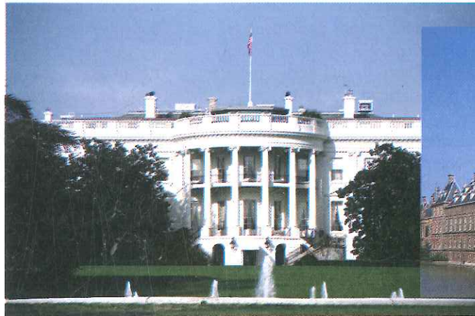
Casa Blanca, sede de la Presidencia de los Estados Unidos.

En este capítulo comenzamos el estudio del gobierno. Explicaremos su definición, sus perspectivas de análisis, las formas de gobierno y su evolución histórica. Luego, a través del concepto de gobernabilidad nos acercaremos al funcionamiento y efectividad de los gobiernos, y propondremos una reflexión sobre sus desafíos en la actualidad.