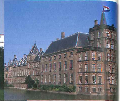
Parlamento de los Países Bajos.