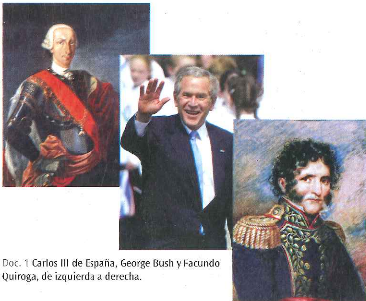
Doc. 1 Carlos III de España, George Bush y Facundo Quiroga, de izquierda a derecha.