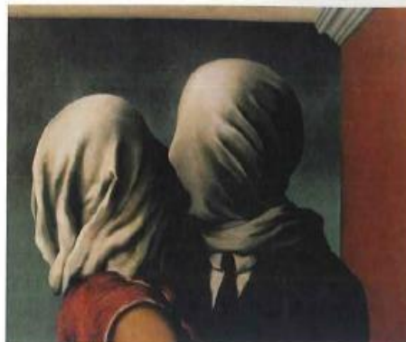
Obra del pintor belga René Magritte (1898-1967), Los amantes , 1928.

Es pertinente aclarar que la capacidad connotativa del lenguaje poético implica que no existe un único modo privilegiado de leer (o interpretar) un poema: varias interpretaciones son posibles. Como el discurso poético dice de un modo no habitual, sorprende y establece una relación especial entre sonidos y conceptos; se abre así a nuevas significaciones, porque el lector asocia de diversas maneras los sentidos de las palabras que el texto combina y las imágenes que proponen los versos. Las sucesivas lecturas de distintas generaciones y distintos períodos históricos, e incluso de una misma persona en diferentes momentos de su vida, provocan nuevas connotaciones que dan lugar a otros modos de construir los sentidos de un texto.