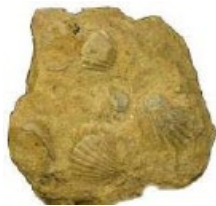
Coquina, formada por fragmentos de caparzones.

- Coquina: roca compuesta de agregados no consolidados, pobremente cementados, de conchas, esqueletos de corales y fragmentos de estos, que han sido fracturados mecánicamente por procesos naturales (p.ej.: acción de las olas del mar).