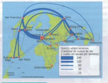
Doc. 1 Flujo del tráfico aéreo mundial.

► El siglo XX trajo grandes avances en las tecnologías de transporte, como nuevos tipos de motores y, sobre todo, la incorporación de un modo totalmente novedoso, el transporte aéreo. Este modo inauguró la posibilidad de desplazamiento por vía aérea que impulsó los viajes intercontinentales en tiempos hasta ese momento impensados por la mayoría de las personas. Otro de los avances es la gran producción de vehículos de automotor desde la década de 1920, medio de amplia aceptación y utilización para el traslado de personas y mercaderías por vía terrestre. El automóvil particular se adaptó a las ciudades, y acompañó el crecimiento de la infraestructura y equipamientos urbanos.