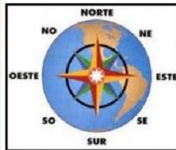
ROSA DE LOS VIENTOS