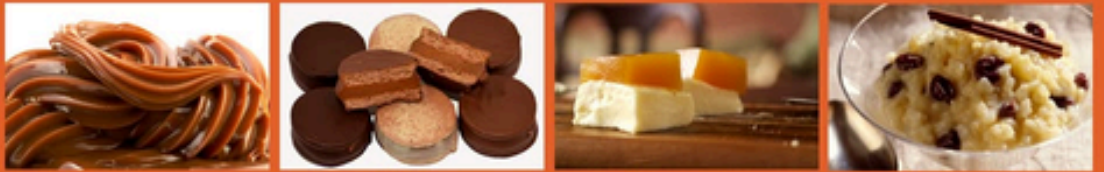
Dulce de Leche