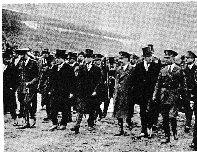
Uriburu con un grupo de civiles en el Hipódromo, tras el golpe de Estado.

Por otra parte, hay que tener en cuenta que si bien Uriburu deseaba realizar un cambio estructural del Estado, veremos que la década del 30 significará el simple retorno a las prácticas fraudulentas de los gobiernos conservadores.