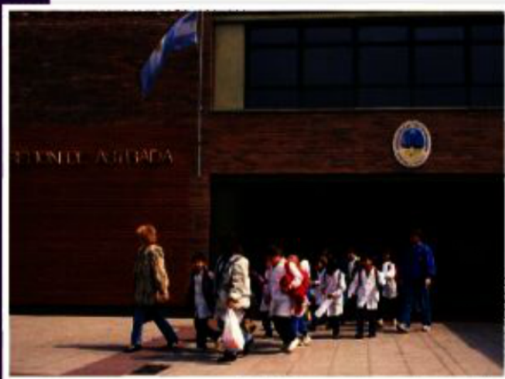
► El respeto por nuestros símbolos patrios comenzó a transmitirse en las escuelas.

El concepto de nación hace referencia a un conjunto amplio de individuos y grupos que se sienten parte de una misma comunidad por razones históricas, étnicas, lingüísticas o religiosas. Esto quiere decir que cada nación está conformada por aquellas personas que comparten un mismo idioma, una historia común y una serie de tradiciones y costumbres que la diferencian de otras comunidades, y que generan un sentimiento de pertenencia. Pero para que exista una nación es necesario, además, que quienes conforman esa comunidad se reconozcan con derecho a tener autonomía en la decisión de los asuntos que afectan la vida en común.