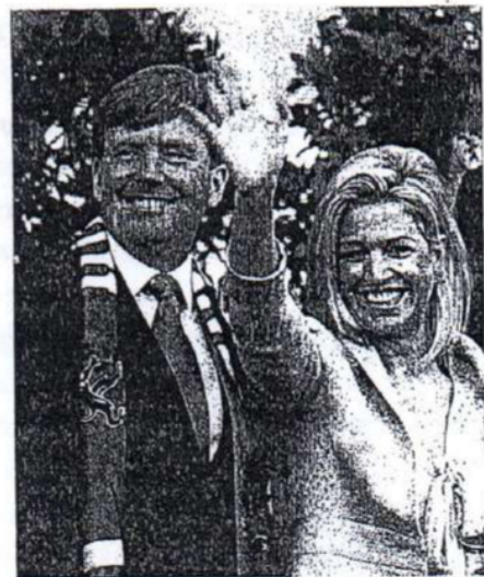
En Holanda, la familia real (en la foto, los príncipes de Orange) no tiene poder de decisión en las políticas del Estado. Es una monarquía constitucional parlamentaria.

La mayoría de las monarquías actuales, como la del Reino Unido o la de Holanda, son parlamentarias, es decir que el poder del rey es compartido con los otros órganos de gobierno y, además, está sometido a la regulación que indica la Constitución.