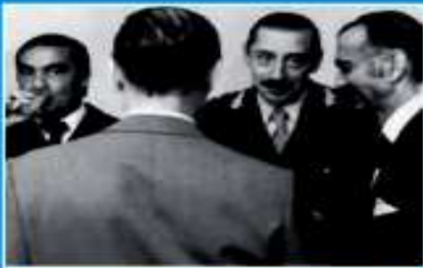
• Martínez de Hoz (el primero de la derecha) junto con Videla, Massera y Agosti