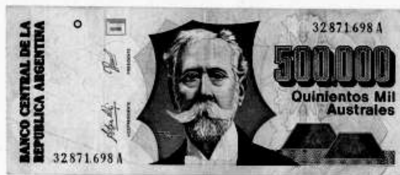
Billete de quinientos mil Australes

una deuda externa de 45.000 millones de dólares debida, entre otros factores, a la estatización de la deuda privada durante la dictadura. Esta deuda era equivalente a las exportaciones que se realizaban en un período de cinco años; quizás más, porque para colmo en ese momento estaban descendiendo los precios de los productos agrícolas. La banca acreedora y los grupos económicos concentrados ejercieron presión contra la política económica del ministro Bernardo Grinspun y el equipo fue cambiado en 1985. 11 Asumió Juan V. Sourrouille , que priorizó los condicionamientos expuestos por los grupos de presión. Alfonsín convocó al pueblo en apoyo a su gobierno y anunció la implantación de una "economía de guerra", que indignó a la gente que fue a la plaza. Pero el "Plan Austral" (plan económico con una nueva moneda) frenó la inflación y Alfonsín recuperó la confianza del pueblo. El gobierno disminuyó la deuda pública aplicando una desindexación a los acreedores internos. Se congelaron precios, tarifas públicas y salarios. Según David Rock, el plan no era muy diferente del de Rodrigo en la época de Isabelita, pero funcionó por el acuerdo público y gracias a ello el radicalismo obtuvo una victoria electoral en las elecciones para diputados en 1985. En 1987 ya se presentaron