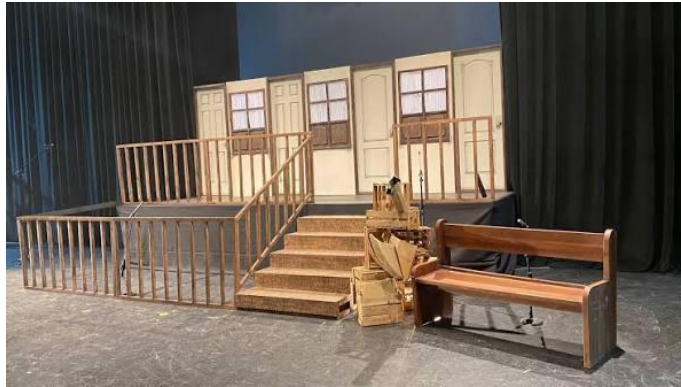
Imagen n°5: Escenografía funcional

En la imagen se observan varios elementos escenográficos que sugieren la representación de una escena teatral. Hay un decorado que simula la fachada de una casa o edificio con tres puertas y tres ventanas. El decorado tiene un color beige con marcos de madera en las puertas y ventanas.