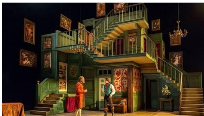
Imagen n°6: Escenografía funcional

En la imagen se observan varios elementos escenográficos que sugieren la representación de una escena teatral. Hay un decorado que simula la fachada y el interior de una casa de varios niveles, con escaleras que conectan diferentes partes de la estructura.