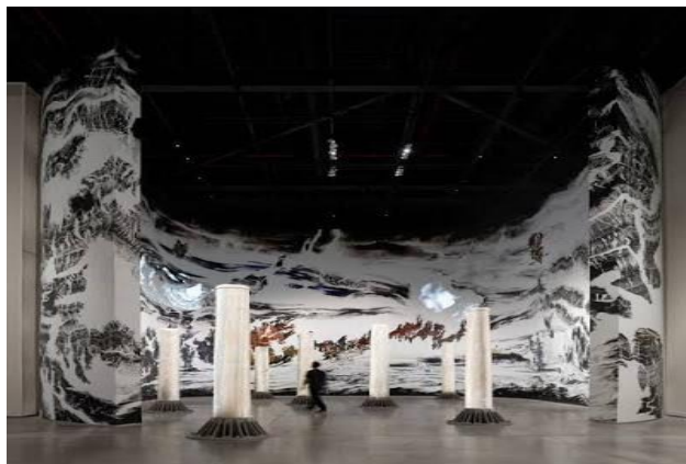
Imagen n°3: Escenografía abstracta

En general, la imagen presenta un ambiente tranquilo y estéticamente minimalista, con un enfoque en la armonía de formas y colores suaves.