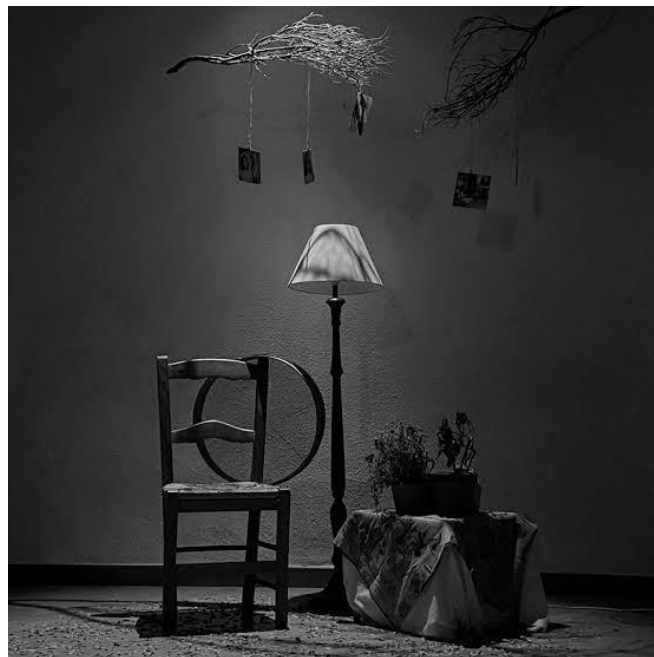
Imagen n°7: Escenografía minimalista

En la imagen en blanco y negro se observan varios elementos escenográficos que configuran un ambiente sombrío y minimalista. El decorado incluye una pared con textura que parece ser parte del interior de una habitación, y un suelo cubierto parcialmente por una alfombra o tapete sobre el que se disponen los objetos principales. Del techo cuelgan ramas secas con pequeños objetos, posiblemente tags o adornos, atados a ellas. En la pared a la derecha se aprecian fotos o imágenes pequeñas pegadas.