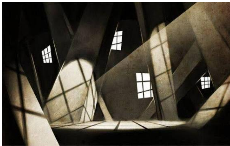
Imagen n°4: Escenografía abstracta

En la imagen no se observan elementos escenográficos como decorado, vestuario, maquillaje o utensilios en el sentido tradicional. El espacio interior mostrado tiene una arquitectura única con paredes angulares y ventanas pequeñas con marcos en cuadrícula.