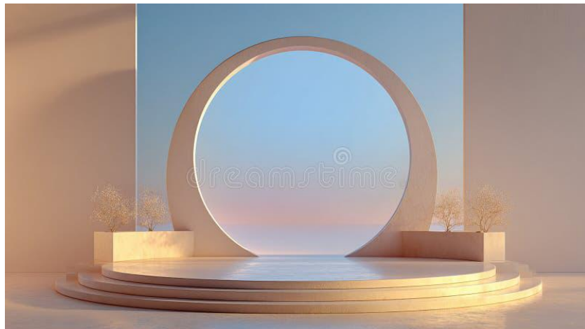
Imagen n°8: Escenografía minimalista

Se observan varios elementos escenográficos que configuran un ambiente minimalista y sereno. El decorado incluye una plataforma circular de tres niveles con un gran arco circular detrás. Este arco enmarca un cielo azul con tonos de atardecer en la parte inferior. A los lados de la plataforma hay dos maceteros rectangulares con árboles pequeños y delicados. Las paredes del fondo y laterales son de un color neutro, como beige o crema, lo que aporta simplicidad al espacio.