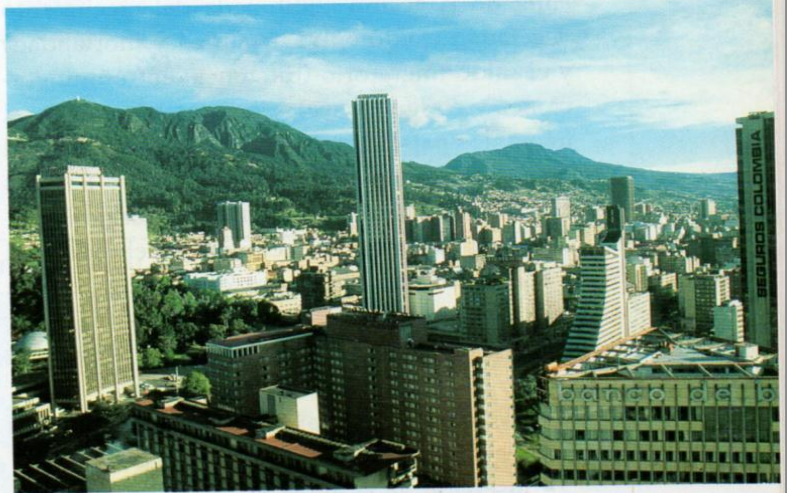
Ciudad de Bogotá, Colombia, a 2.640 m de altura.