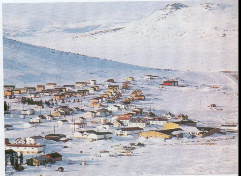
Los desiertos blancos constituyen áreas de baja densidad de población por el clima frío y las bajas temperaturas. En la fotografía se observa la localidad de Nain, en la península del Labrador, Canadá.