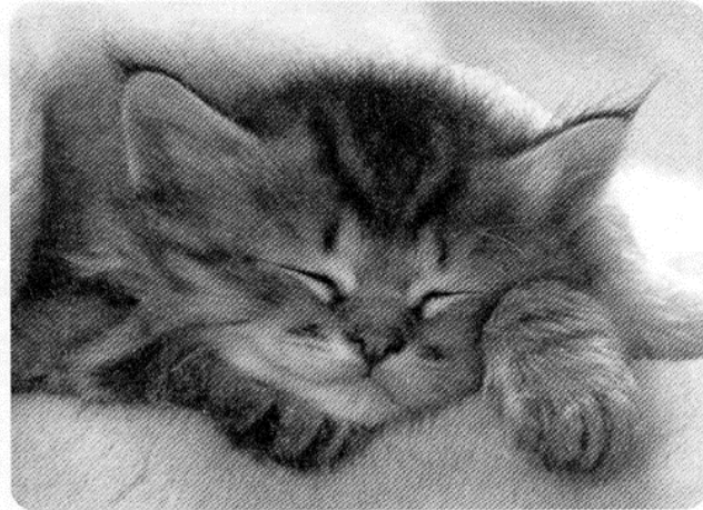
Los gatos son excelentes animales de caza gracias al desarrollo de sus sentidos.