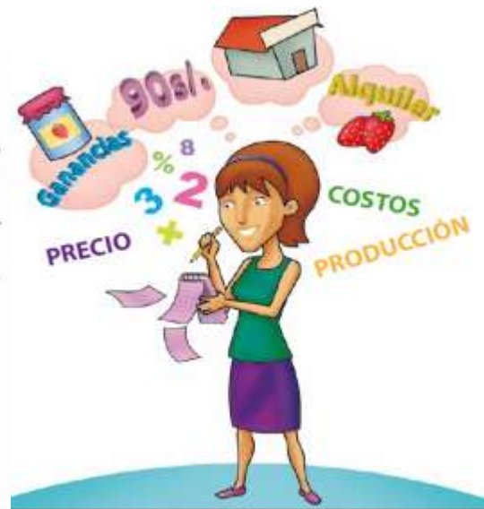
EJEMPLO DE MATERIALES O INSUMOS PARA FABRICAR MERMELADA DE FRESA