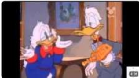
El Tio Gilito y la Inflación

https://youtu.be/33ozcFcgWlc?si=i6ufu7zW7aisKp5c