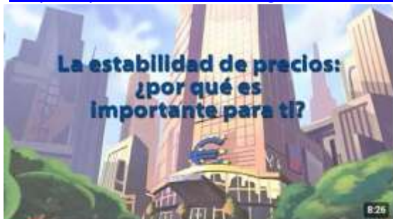
inflación y deflación explicada por el BCE

https://youtu.be/33ozcFcgWlc?si=i6ufu7zW7aisKp5c