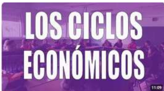
Qué son los ciclos económicos y cuáles son sus

https://youtu.be/dHKxCW40_v8?si=q4ZGpPBBnWDs3ILL