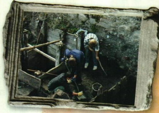
▲ Los arqueólogos excavan en busca de restos materiales de las civilizaciones antiguas.

H ace cientos e incluso miles de años existieron sociedades que alcanzaron grandes logros culturales y fueron muy poderosas. Hoy, lo único que queda de ellas son objetos dispersos, algunos testimonios escritos y ruinas de sus construcciones. Estos restos atraen la atención de los arqueólogos, que intentan descubrir cómo hicieron estas sociedades para prosperar y lograr tanto esplendor.