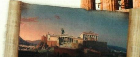
Esta es una recreación, hecha por un artista, de la vida en la antigua Grecia, en los alrededores de la Acrópolis. Fue realizada de acuerdo con las investigaciones ▶