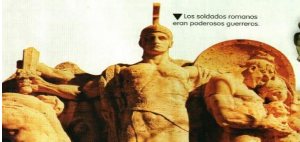
▼ Los soldados romanos eran poderosos guerreros.