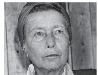
Simone de Beauvoir (1908-1986)

En su obra Un cuarto propio , esta autora escribe sobre la condición femenina. Esta obra se ha convertido en un icono de la literatura del siglo XX. Defiende tener una vida propia e independiente. Un cuarto propio es un elegante ensayo que ya en 1929 ponía sobre la mesa unos temas que todavía hoy son objeto de debate, como la dependencia económica de la mujer con respecto al hombre, el cuidado de la familia y la figura de la mujer como musa inspiradora del artista, pero con poca presencia en la práctica de la creatividad.