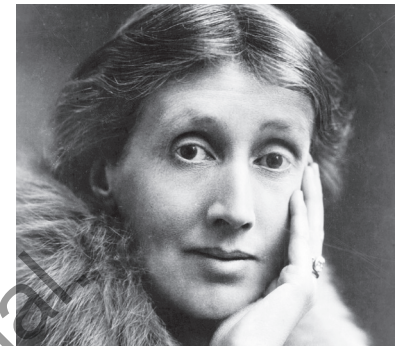
Virginia Woolf (1882-1941)

De nacimiento Adeline Virginia Stephen, fue una escritora británica, considerada una de las más destacadas figuras del modernismo anglosajón del siglo XX y del feminismo internacional.