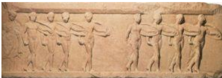
Danza pírrica. Museo de la Acrópolis. Atenas

La danza podemos encontrarla en el mismo origen del ser humano, pues ya el hombre primitivo la utilizó, muy tempranamente, como forma de expresión y de comunicación, tanto con los demás seres humanos, como con las fuerzas de la naturaleza que no dominaba y que consideraba divinidades. Entre los hombres primitivos la danza tenía un sentido mágico animista, pero también valor de cohesión social. La danza sirve para infundir ánimo a los guerreros, para el cortejo amoroso, para ejercitarse físicamente, etc.