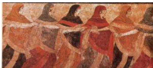
Pintura fúnebre. Museo arqueológico nacional. Nápoles

Tenemos que considerar que el elemento fundamental de la danza está en la propia naturaleza humana: el ritmo, que le viene dado por su propio funcionamiento orgánico, con la respiración y los latidos del corazón. El mismo principio que hace nacer la música en los orígenes de la humanidad, hace también nacer la danza, que están unidas indisolublemente.