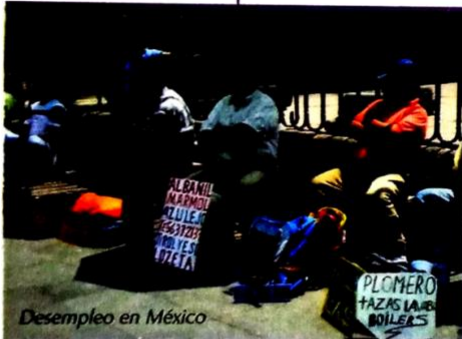
Desempleo en México