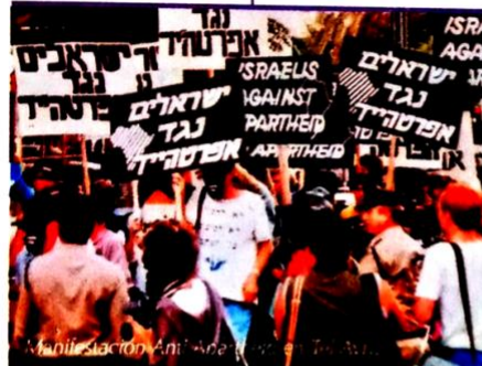
Manifestación Anti-Apartheid en Tel Aviv