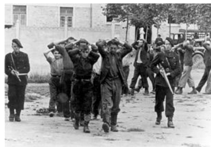
Las violaciones de los derechos humanos han sido sistemáticas durante los regímenes de gobierno no democráticos (Francia 1944, Chile 1973)