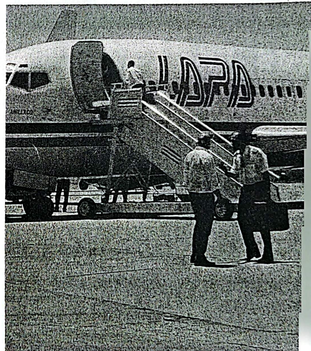
Whisky, Romeo, Zulu . Enrique Piñeyro, 2004.

Dos películas argentinas se ocuparon del tema de Psicología laboral. Una de ellas, El Método (Marcelo Piñeyro, 2005), donde siete aspirantes a un puesto de ejecutivo en una empresa multinacional son seleccionados a través del Método Gronhólm con la participación de un psicólogo infiltrado entre ellos. La segunda es Whisky, Romeo, Zulu (Enrique Piñeyro, 2004), un relato apenas ficcionado de la tragedia aérea de LAPA en el Aeroparque Metropolitano.