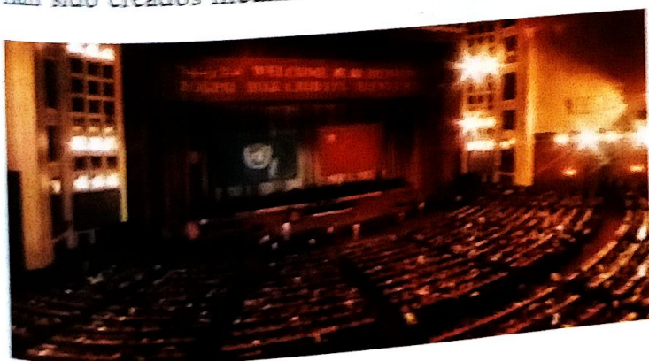
Asamblea General de las Naciones Unidas.